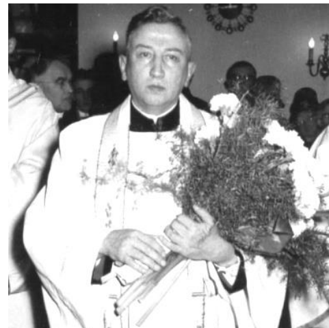
Silbernes Priesterjubiläum August 1962

Anfang 1961 durften die Kinder den neuen Kindergarten Marienau und das dazugehörige Schwesternhaus im Hahnenhof in Betrieb nehmen.